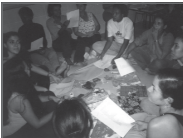
Professores trabalhando juntos

As questões aqui levantadas apontam para a necessidade de se criar uma rede de trocas de informações, experiências, saberes e reflexões sobre o fazer pedagógico, confrontados com os referenciais teóricos que fundamentam a aprendizagem significativa e a construção do conhecimento de forma coletiva.