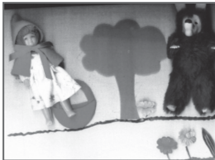
História infantil adaptada pela mãe e professoras- Jacobina, Bahia

Faz-se necessário selecionar as atividades, diminuindo o grau de dificuldade ou nível de abstração, e partir sempre do que é conhecido, dos significados já adquiridos pelo aluno. Oferecer apoio ou ajuda para realização de atividades nas quais o aluno mostre maior dificuldade, modificar a seqüência ou a maneira de realizar determinadas atividades são também estratégias válidas.