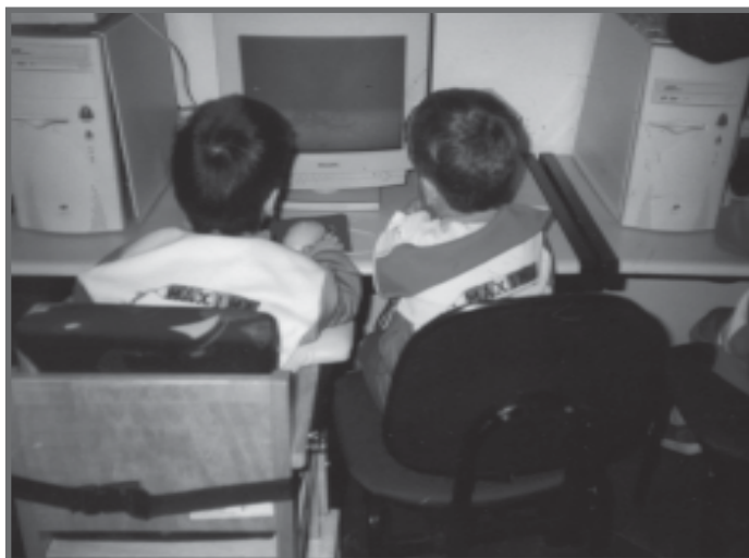
Inclusão em C.E.I em Campo Grande (MS)

Oferecer espaço adequado à movimentação das crianças, mobiliários interativos, brinquedos e mobiliário adaptados, quando necessários, são organizações essenciais para o desenvolvimento e aprendizagem de todas as crianças. E são providências e medidas indispensáveis para a inclusão escolar e social.