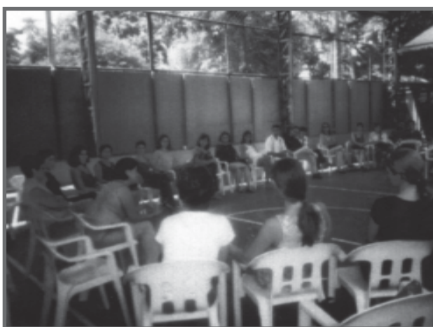
Pais e professores: discussão e decisão coletiva

Nessa perspectiva, tendo como ponto de partida e de chegada a relação dialógica, os conflitos vividos no interior da sala de aula e o potencial da escola para criação de rede de apoio e ajuda mútua envolvendo os pais e os recursos disponíveis na comunidade, e tendo em vista o sucesso no processo de aprendizagem de todos os alunos, é que gostaríamos de compartilhar com vocês alguns desafios e experiências exitosas.