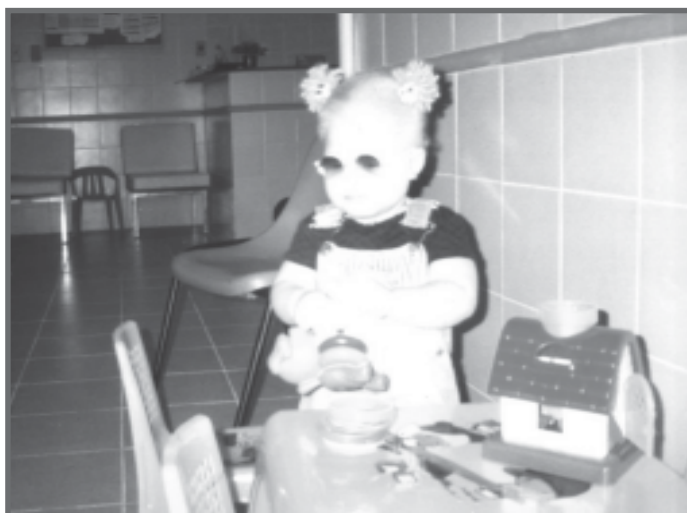
Centro de Intervenção Precoce (CIP) - Salvador, BA.

O trabalho integrado com as áreas da saúde e ação social é prioritário para a aquisição de órteses, próteses e equipamentos específicos.