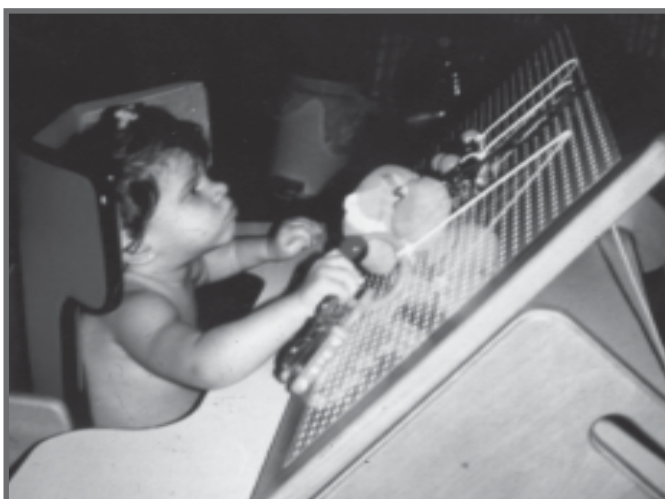
Inclusão em C.E.I. Rio de Janeiro no nível maternal.

É importante ressaltar que a inclusão de alunos com deficiência não depende do grau de severidade da deficiência ou do nível de desempenho intelectual mas, principalmente, da possibilidade de interação, socialização e adaptação do sujeito ao grupo, na escola comum. E esse é o maior desafio para a escola hoje – modificar-se e aprender a conviver com dificuldades de adaptação, gostos, interesses e níveis diferentes de desempenho escolar.