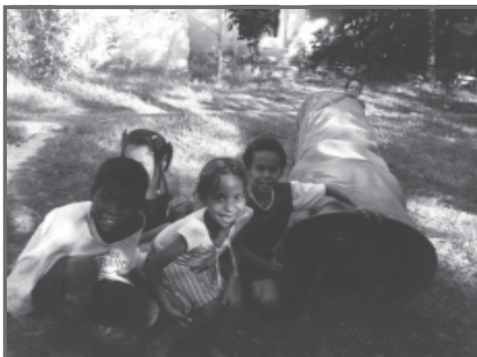
Crianças deficientes auditivas e visuais incluídas na Escola Municipal Caminho, Lagoinha, Bahia.

Assim, o processo de avaliação na perspectiva da educação inclusiva e da aprendizagem significativa não está centrado apenas no desenvolvimento de habilidades e competências, nem na capacidade de assimilar conteúdos e acumular informações, mas sim na possibilidade de pensar, fazer escolhas, agir com autonomia, relacionar-se com o outro e com o objeto de conhecimento, de comunicar-se, expressar sentimentos, idéias, resolver problemas, criar soluções, desenvolver a imaginação e participar criticamente da cultura para transformação de sua comunidade.