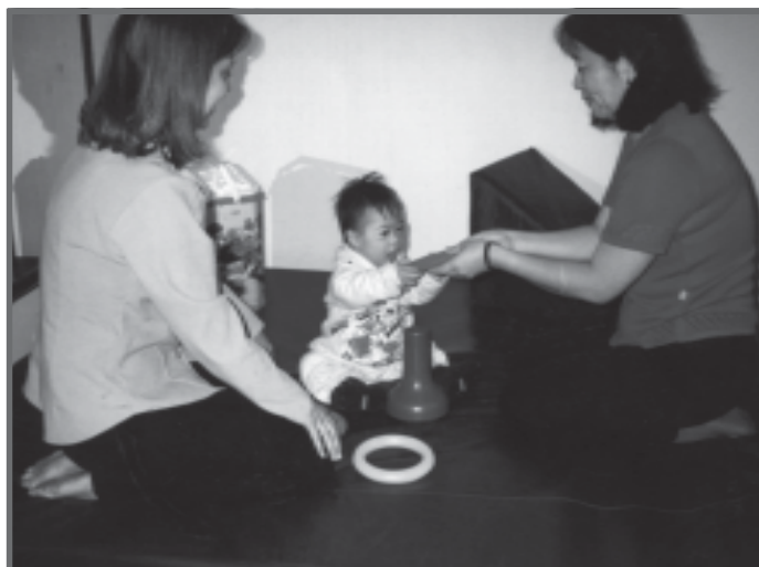
Programa de intervenção precoce. (CEES – Centro de Estudos da Ciência e da Saúde, UNESP - MARÍLIA, SP)

Os programas de intervenção precoce do nascimento aos três anos de idade são imprescindíveis para a promoção das potencialidades e aquisição de habilidades e competências. Eles devem ser, portanto, desenvolvidos em interface com os serviços de saúde, tendo em vista que essas crianças necessitam, algumas vezes, de orientação ou atendimento complementar nas áreas de fisioterapia, fonoaudiologia, terapia ocupacional e psicologia.