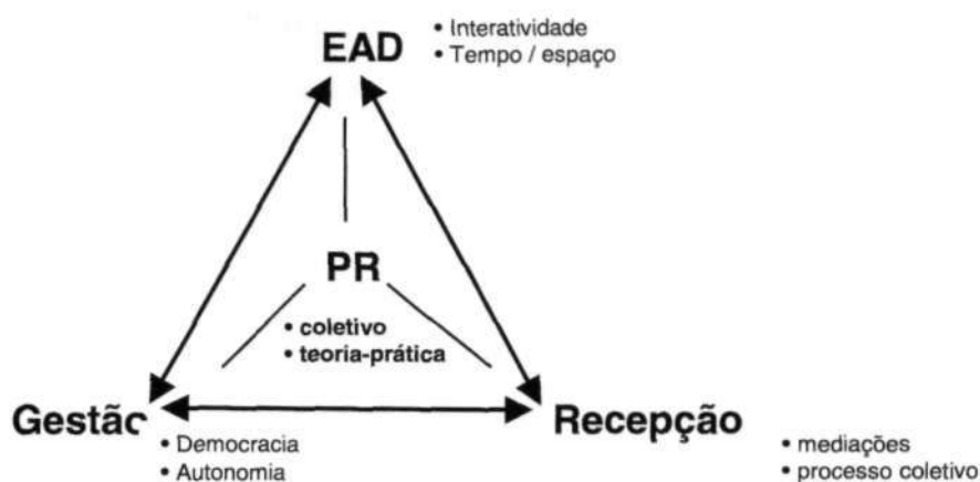
Gráfico 1 - Interrelações entre os elementos do estudo