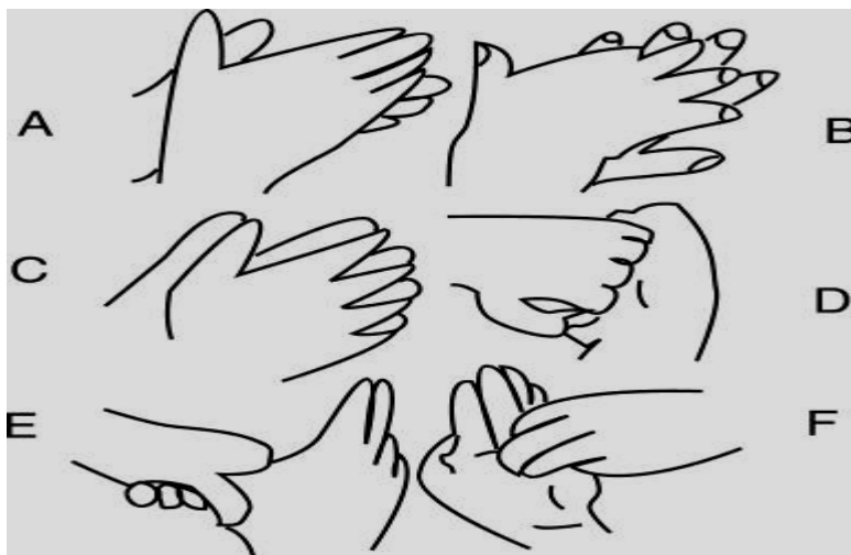
Figura 1 – Procedimento de lavagem das mãos