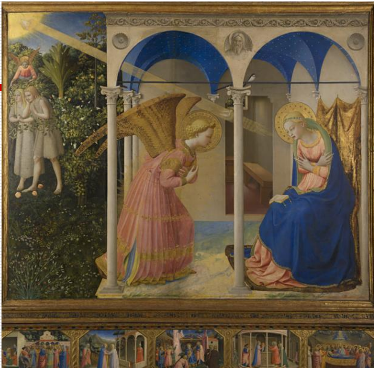
Anunciação (1496) Fra Angelico. 194 x 194 cm. Museo del Prado, Madrid