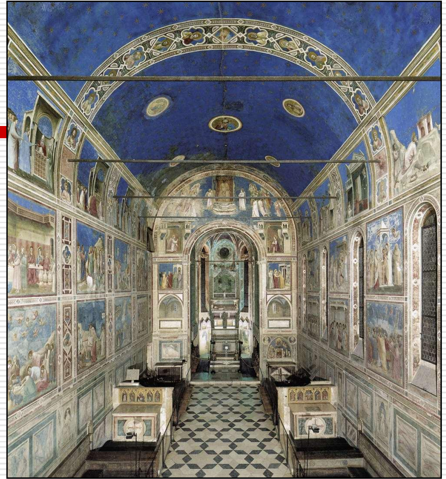
Capella degli Scrovegni -1305 – Pádua - Itália