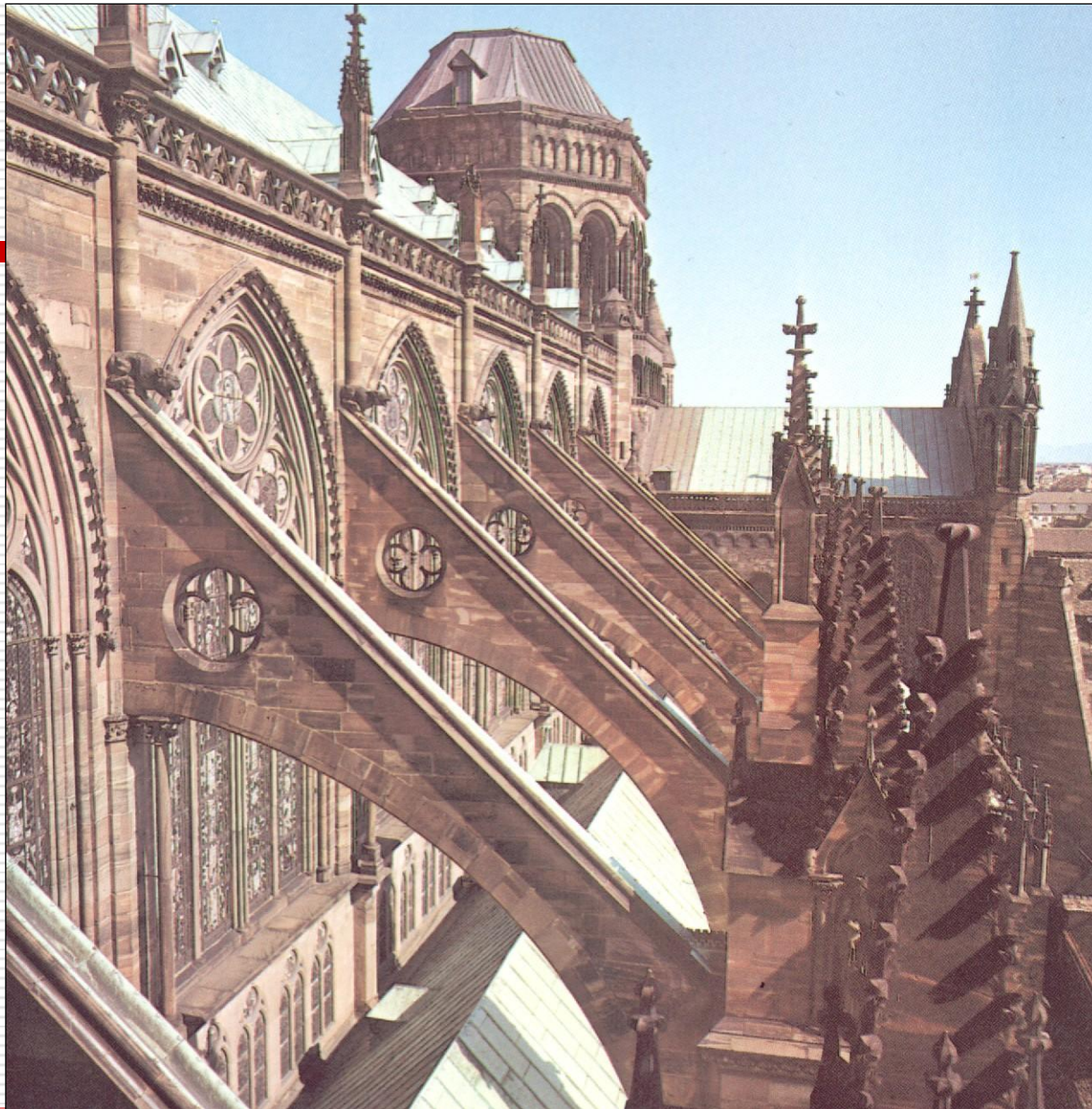
Arcobotantes da Catedral de Estrasburgo 1220