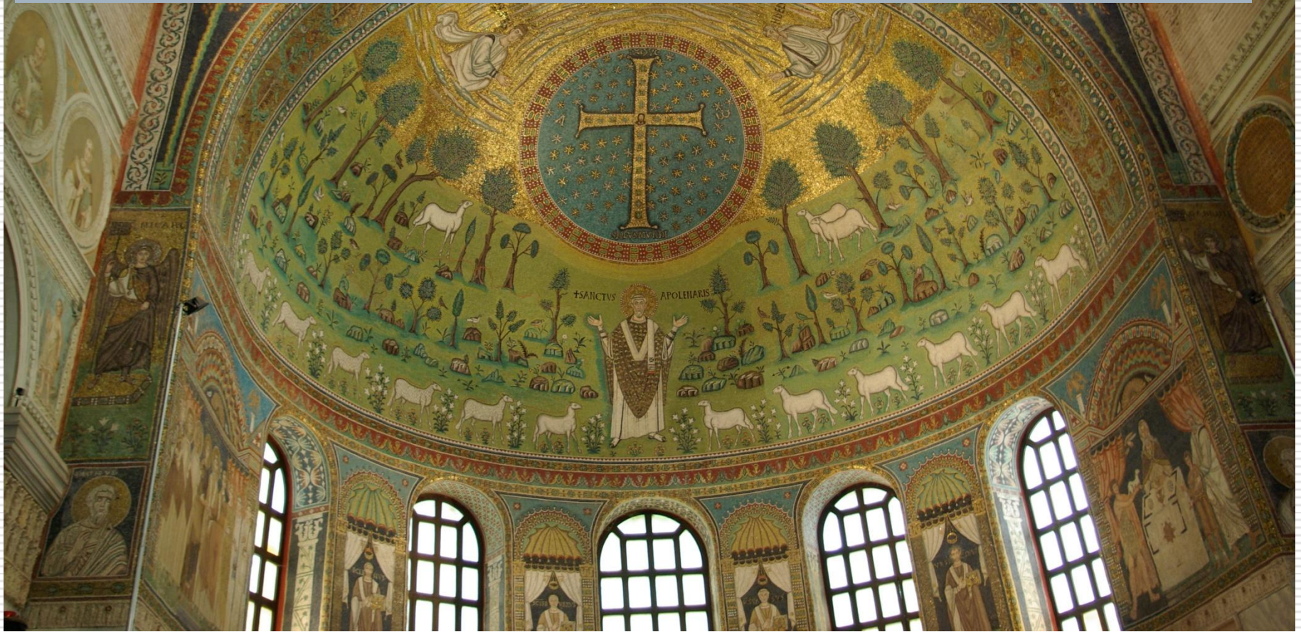
Basilica de Santo Apolinário Ravena - 530

Contexto: império de Justiniano, século VI.