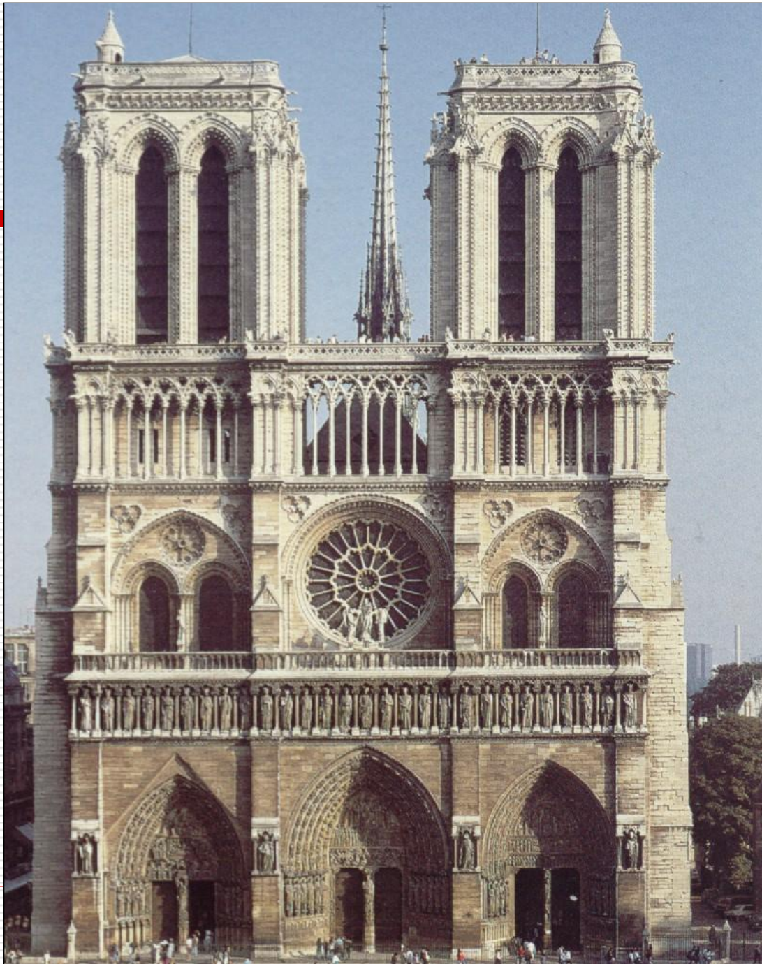
Catedral de Notre Dame Paris – 1163-1182 (130 x 48 x 32 – 90 m)