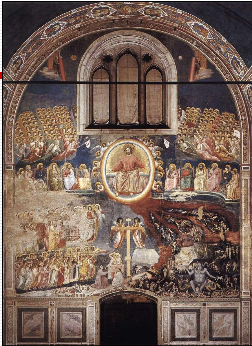
Last Judgment 1306 Fresco Giotto di Bondone - Cappella Scrovegni (Arena Chapel), Padua