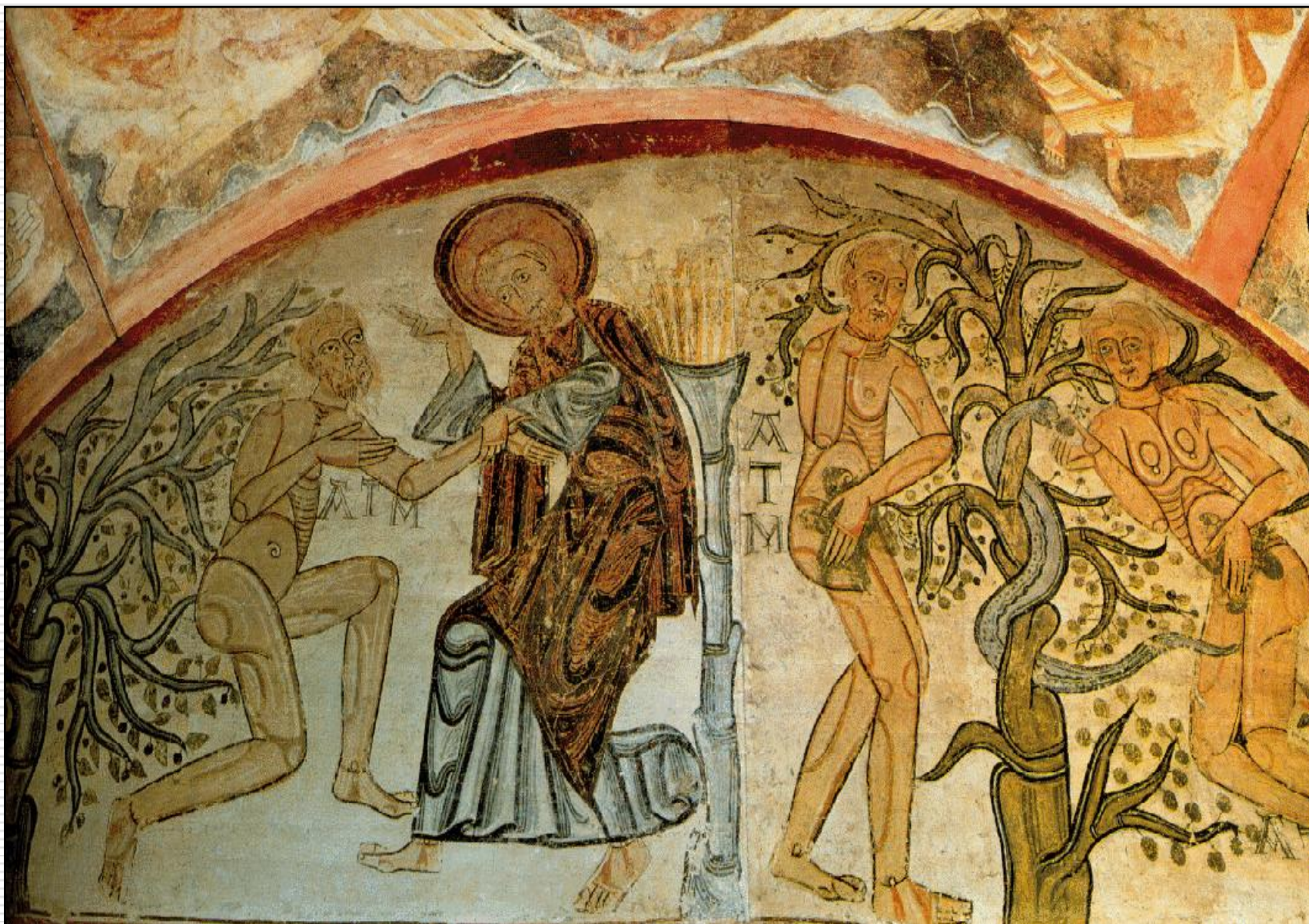
A Expulsão do Paraíso (arte românica) – Museu do Prado - Madri