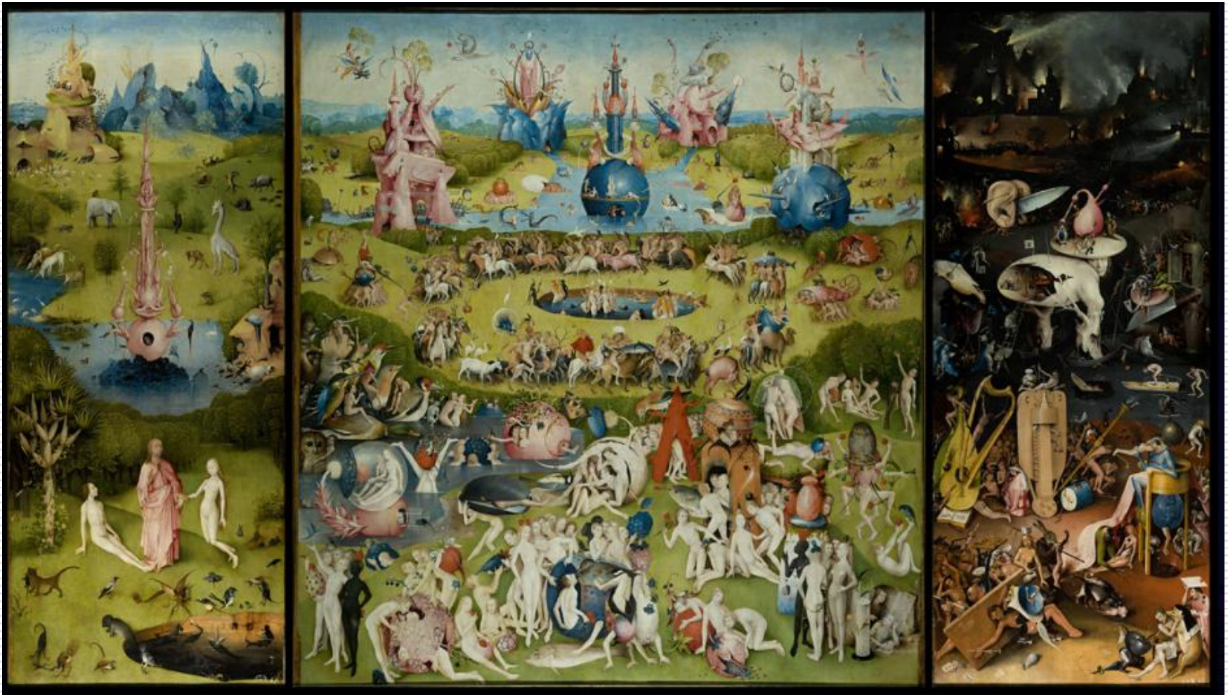
O Jardim das Delícias (1499-1505) Bosch (El Bosco) Óleo sobre tela - 220 cm 389 cm Museo del Prado