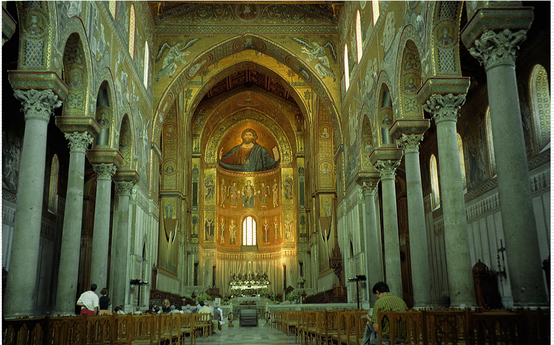
Cattedrale di Monreale, Sicilia, Italia, século XII