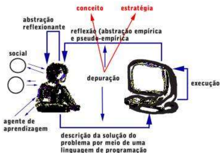
Figura 1 – Interação aprendiz-computador na situação de programação

O ciclo em que se dá o processo de programação pode acontecer também quando o aprendiz utiliza outros software , como processador de texto ou sistemas de autoria (Valente, 1993; Valente, 1999a). A diferença da programação para esses outros usos é o quanto esses outros software oferecem em termos de facilidade para a realização do ciclo descrição-execução-reflexão-depuração-descrição . A limitação não está na possibilidade de representar conhecimento, mas na capacidade de execução do computador. Por exemplo, no processador de texto é muito fácil representar idéias, e a representação é feita por intermédio da escrita em língua materna. Porém, o computador ainda não tem capacidade de interpretar esse texto fornecendo um resultado sobre o conteúdo do mesmo. Ele pode fornecer informação sobre a formatação do texto, ortografia e, em alguns casos, sobre aspectos gramaticais. Mas não ainda sobre o significado do conteúdo. Isto tem que ser realizado por uma pessoa que lê o texto e fornece o “resultado” desta leitura em termos de significados, coerência de idéias etc.