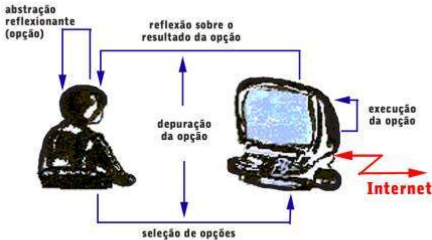
Figura 2 – Interação aprendiz-computador navegando na internet

A internet está ficando cada vez mais interessante e criativa, possibilitando a exploração de um número incrível de assuntos. Porém, se o aprendiz não tem um objetivo nesta navegação ele pode ficar perdido. A idéia de navegar pode mantê-lo ocupado por um longo período de tempo, porém muito pouco pode ser realizado em termos de compreensão e transformação dos tópicos visitados em conhecimento. Se a informação obtida não é posta em uso, se ela não é trabalhada pelo professor, não há nenhuma maneira de estarmos seguros de que o aluno compreendeu o que está fazendo. Nesse caso, cabe ao professor suprir essas situações para que a construção do conhecimento ocorra.